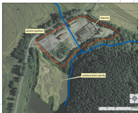
Ukázka znázornění lokality posuzované ekologické zátěže

Je zajišťována posudková činnost – konkrétně jsou posuzovány dopady jednotlivých lokalit vsakování, jednotlivé studny, vrtů a jímací území atp. Posudky jsou dále zhotovovány pro vybrané ekologické zátěže, jejich dopad na kvalitu vod, popřípadě jsou posuzovány projekty sanací ekologických zátěží a podobná témata. Zhotovovány jsou analýzy rizik kontaminovaných míst. Na jednotlivých lokalitách je prováděn monitoring kvality vod a sedimentů.