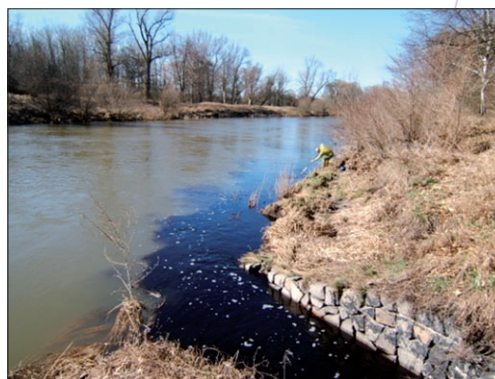
Odběr vzorků pro stanovení vlivu ekologické zátěže na tok Labe

Probíhá i studium dopadů environmentálních změn na kvalitu povrchové vody za využití matematických modelů, např. studie potenciálního vlivu klimatické změny na kontaminaci dusíkem v toku Jizery. Je kladen důraz na posouzení nejistot matematického modelování tohoto typu.