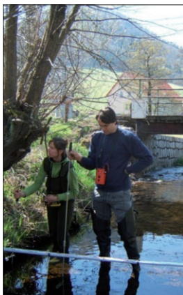
Společné měření na hraničních vodách s Polskem