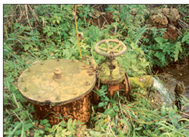
Artéský přetok podzemní vody z posuzovaného starého vrtu

Provádí se výzkum negativních dopadů starších vrtných prací na režim a jakost podzemních vod.